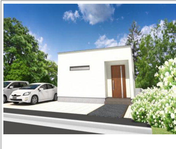
写真 完成予想図です！